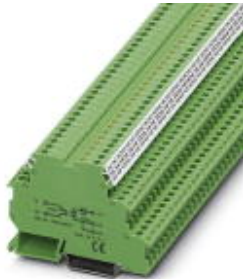
Leistungs-Solid-State-Relaisklemme, Eingang: 24 V DC, Ausgang: 3-30 V DC/3 A, Klemmenbreite 6,2 mm

Bitte beachten Sie, dass die hier angegebenen Daten dem Online-Katalog entnommen sind. Die vollständigen Informationen und Daten entnehmen Sie bitte der Anwenderdokumentation. Es gelten die Allgemeinen Nutzungsbedingungen für Internet-Downloads. ( http://download.phoenixcontact.de )