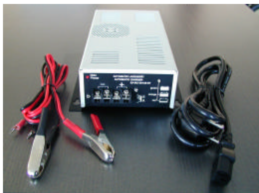
Gesamtansicht inklusive Zubehör