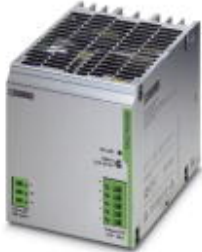
Tragschienen-Stromversorgung, primär getaktet, 1-phasig, Ausgang: 24 V DC / 20 A

Bitte beachten Sie, dass die hier angegebenen Daten dem Online-Katalog entnommen sind. Die vollständigen Informationen und Daten entnehmen Sie bitte der Anwenderdokumentation. Es gelten die Allgemeinen Nutzungsbedingungen für Internet-Downloads. ( http://download.phoenixcontact.de )