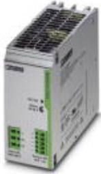
Tragschienen-Stromversorgung, primär getaktet, 1-phasig, Ausgang: 48 V DC / 5 A

Bitte beachten Sie, dass die hier angegebenen Daten dem Online-Katalog entnommen sind. Die vollständigen Informationen und Daten entnehmen Sie bitte der Anwenderdokumentation. Es gelten die Allgemeinen Nutzungsbedingungen für Internet-Downloads. ( http://download.phoenixcontact.de )