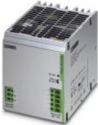
Tragschienen-Stromversorgung, primär getaktet, 1-phasig, Ausgang: 48 V DC / 10 A

Bitte beachten Sie, dass die hier angegebenen Daten dem Online-Katalog entnommen sind. Die vollständigen Informationen und Daten entnehmen Sie bitte der Anwenderdokumentation. Es gelten die Allgemeinen Nutzungsbedingungen für Internet-Downloads. ( http://download.phoenixcontact.de )