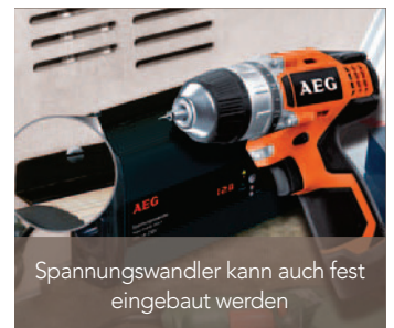
Spannungswandler kann auch fest eingebaut werden