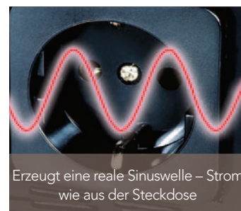
Erzeugt eine reale Sinuswelle – Strom wie aus der Steckdose