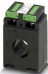
Rohrstabstromwandler, Primärstrom 100 A AC; Sekundärstrom 5 A AC; Genauigkeitsklasse 1; Bemessungsleistung 2,5 VA

Bitte beachten Sie, dass die hier angegebenen Daten dem Online-Katalog entnommen sind. Die vollständigen Informationen und Daten entnehmen Sie bitte der Anwenderdokumentation. Es gelten die Allgemeinen Nutzungsbedingungen für Internet-Downloads. ( http://download.phoenixcontact.de )