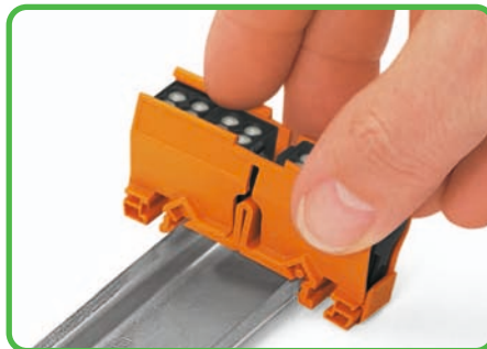
Aufrasten auf die Tragschiene