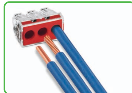
Anschluss ein- und mehrdrähtiger Leiter 6 mm 2

In Verbindung mit dem als Zubehör erhältlichen Befestigungsadapter kann die Klemme in der Lage fixiert und beschriftet werden. Der mit maximal 2 Klemmen ausrüstbare Befestigungsadapter kann auf der Tragschiene auf Tragschiene DIN 35 aufgerastet oder mittels zweier Schrauben auf glatter Oberfläche befestigt werden.