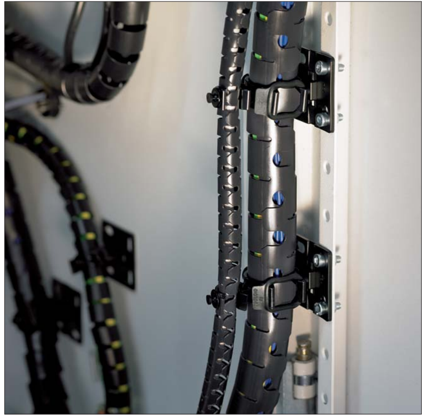
Schutz und Befestigung von Kabeln und Leitungen mit dem Helawrap Zubehör im Industriebereich, z. B. in Schaltschränken.