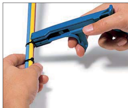
Werkzeug ansetzen, Kabelbinder spannen.