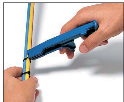
Abschneiden durch Drehen des Werkzeuges.