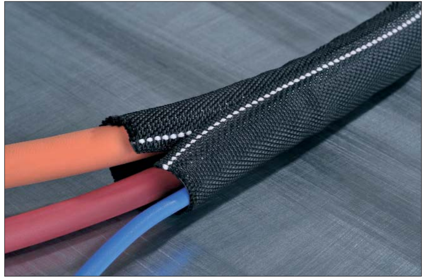
Helagaine Twist-In-FR kann leicht am weißen Kennzeichnungsfaden identifiziert werden.

Helagaine Twist-In-FR eignet sich vor allem für Bereiche, in denen hohe Anforderungen an den Brandschutz gestellt werden, wie bspw. Schienenfahrzeugbau, Luftfahrt und Schiffbau.