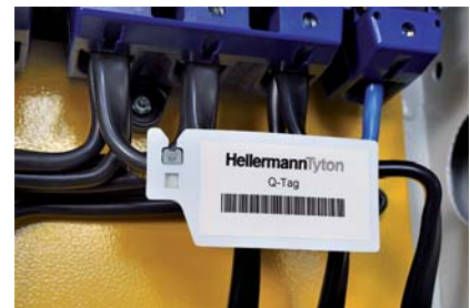
Q-tag für Etiketten oder manuelle Beschriftung.