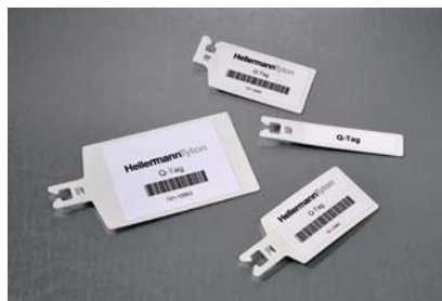
Q-tags sind in unterschiedlichen Größen und Typen erhältlich.