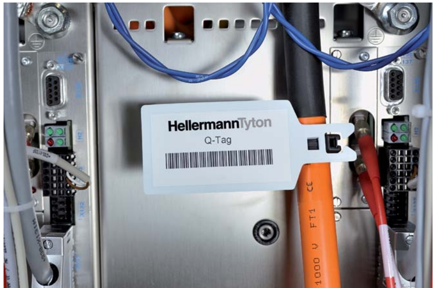
Eindeutige Kennzeichnung und gute Lesbarkeit bringen Sicherheit in sensible Bereiche.

Sichere, klare und dauerhafte Kennzeichnung ist besonders im Bereich industrieller Anwendungen ein wichtiger Sicherheitsaspekt. Die Q-tag Kennzeichnungsschilder verfügen über eine spezielle Aufnahme für den Kopf der Q-tie Kabelbinder. So wird aus Schild und Binder eine Einheit, die sicher am Bündelgut anliegt und für klare und eindeutige Kennzeichnung sorgt. Neben der horizontalen Ausführung gibt es auch vertikal anzubringende Q-tags. Die großzügige Beschriftungsfläche kann manuell mit den Markierstiften der Reihe T82 beschriftet oder mit passenden Etiketten versehen werden.