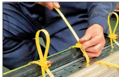
Die Bandenden lassen sich besonders unkompliziert zurückschlaufen.