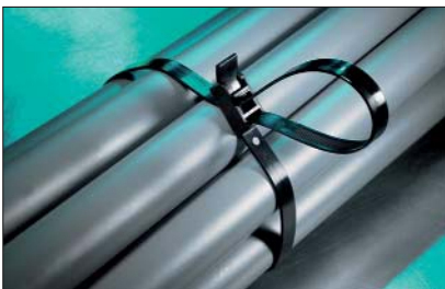
SpeedyTie – schnell und einfach.