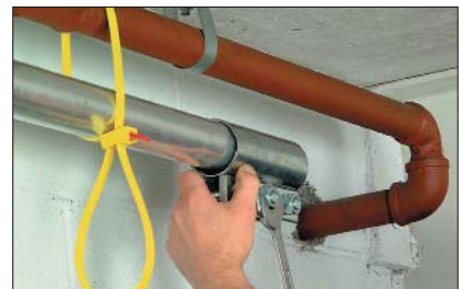
SpeedyTie ist für die temporäre, aber starke Befestigung besonders geeignet.