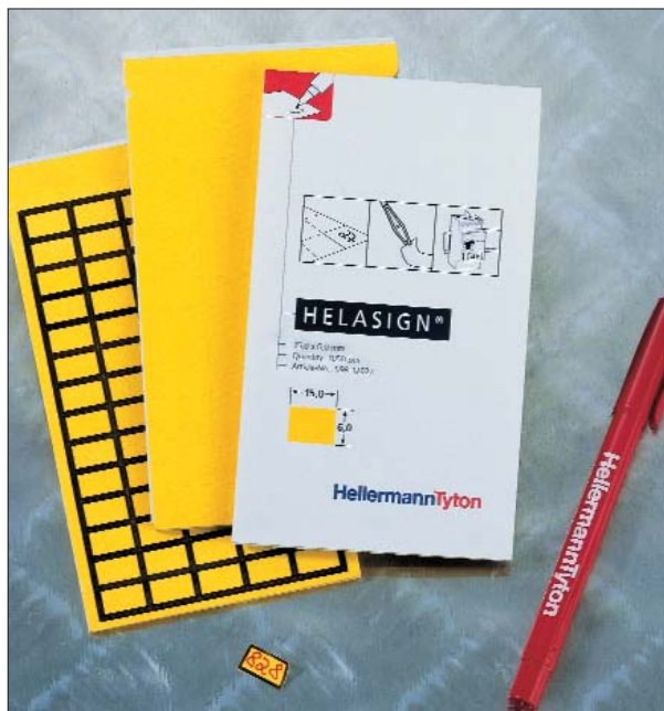
HELASIGN Gewebe-Etiketten – robust und aufmerksamkeitsstark.

Wir empfehlen für die professionelle Handbeschriftung den Markierstift T82, ausgestattet mit einer schnell trocknenden und UV-beständigen Tinte.