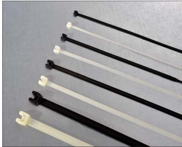
Q-tie Kabelbinder: eine große Auswahl an verschiedenen Abmessungen.

Nähere Beschreibungen der Werkzeuge finden Sie ab Seite 15.