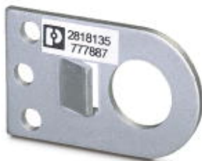
Lasche zur individuellen Befestigung von CN-UB..., z. B. an Gehäusewänden.

Bitte beachten Sie, dass die hier angegebenen Daten dem Online-Katalog entnommen sind. Die vollständigen Informationen und Daten entnehmen Sie bitte der Anwenderdokumentation. Es gelten die Allgemeinen Nutzungsbedingungen für Internet-Downloads. ( http://download.phoenixcontact.de )