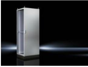
Anreih-Systeme TS 8 IP 66/NEMA 4