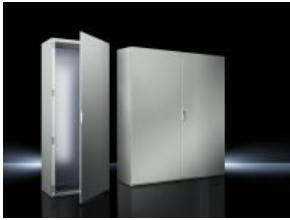
System-Einzelschränke SE 8