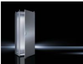
Anreih-Systeme TS 8 Edelstahl