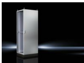
Anreih-Systeme TS 8 IP 66/NEMA 4