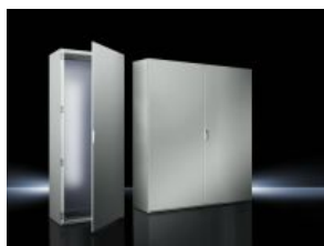
System-Einzelschränke SE 8