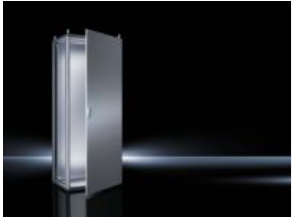
Anreih-Systeme TS 8 Edelstahl