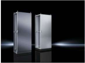
Anreih-Systeme TS 8 IP 66/NEMA 4X