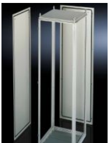
TS 8 Eckschränke