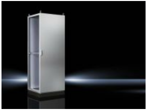
Anreih-Systeme TS 8 IP 66/NEMA 4