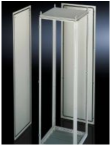
TS 8 Eckschränke