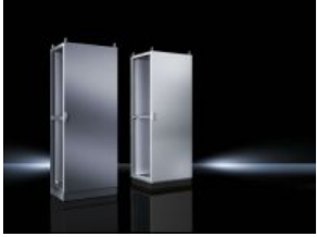
Anreih-Systeme TS 8 IP 66/NEMA 4X