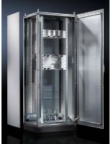
Anreih-Systeme TS 8 EMV-Schränke