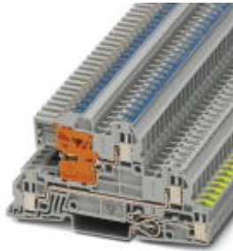
Installationsetagenklemme, Schraubanschluss, Querschnitt: 0,2 mm 2 - 4 mm 2 , AWG: 24 - 12, Breite: 5,2 mm, Farbe: grau, Montageart: NS 35/7,5, NS 35/15

Bitte beachten Sie, dass die hier angegebenen Daten dem Online-Katalog entnommen sind. Die vollständigen Informationen und Daten entnehmen Sie bitte der Anwenderdokumentation. Es gelten die Allgemeinen Nutzungsbedingungen für Internet-Downloads. ( http://download.phoenixcontact.de )