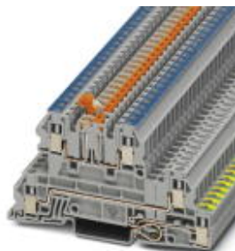
Installationsetagenklemme, Schraubanschluss, Querschnitt: 0,2 mm 2 - 4 mm 2 , AWG: 24 - 12, Breite: 5,2 mm, Farbe: grau, Montageart: NS 35/7,5, NS 35/15

Bitte beachten Sie, dass die hier angegebenen Daten dem Online-Katalog entnommen sind. Die vollständigen Informationen und Daten entnehmen Sie bitte der Anwenderdokumentation. Es gelten die Allgemeinen Nutzungsbedingungen für Internet-Downloads. ( http://download.phoenixcontact.de )