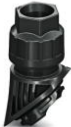
EVO-Kunststoffkabelverschraubung mit Bajonettverschluss; Größe M20, Leitungsdurchmesser 7-13mm

Bitte beachten Sie, dass die hier angegebenen Daten dem Online-Katalog entnommen sind. Die vollständigen Informationen und Daten entnehmen Sie bitte der Anwenderdokumentation. Es gelten die Allgemeinen Nutzungsbedingungen für Internet-Downloads. ( http://download.phoenixcontact.de )