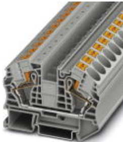
Durchgangsklemme, Anschlussart: Push-in-Anschluss, Querschnitt: 0,5 mm 2 - 25 mm 2 , AWG: 20 - 4, Breite: 12,2 mm, Farbe: grau, Montageart: NS 35/7,5, NS 35/15

Bitte beachten Sie, dass die hier angegebenen Daten dem Online-Katalog entnommen sind. Die vollständigen Informationen und Daten entnehmen Sie bitte der Anwenderdokumentation. Es gelten die Allgemeinen Nutzungsbedingungen für Internet-Downloads. ( http://download.phoenixcontact.de )