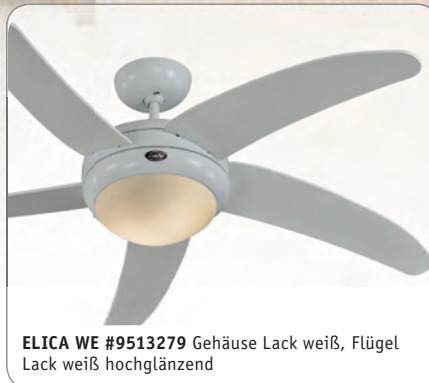
ELICA WE #9513279 Gehäuse Lack weiß, Flügel Lack weiß hochglänzend