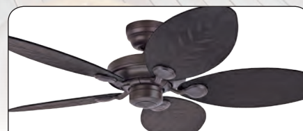
OUTDOOR ELEMENTS NBOD #24323 Gehäuse New Bronze, Kunststoffflügel Palm-/Farnwedeloptik dunkelbraun