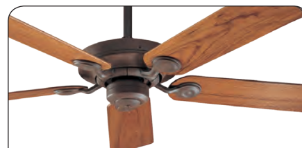
OUTDOOR ELEMENTS WBOD #24324 Gehäusefarbe Weathered Brick, Echtholzflügel Teakholz