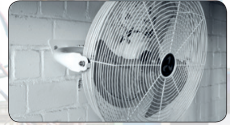
Ein Wandhalter ist im Lieferumfang enthalten.