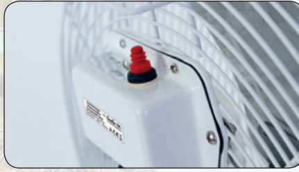
Schalter für Ein-/Aus und Umschaltung der Lei- stungsstufen sind unter einer Gummischutztülle.