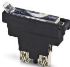
Sicherungsstecker, Nennstrom: 10 A, Länge: 45,4 mm, Breite: 9,9 mm, Farbe: schwarz

Bitte beachten Sie, dass die hier angegebenen Daten dem Online-Katalog entnommen sind. Die vollständigen Informationen und Daten entnehmen Sie bitte der Anwenderdokumentation. Es gelten die Allgemeinen Nutzungsbedingungen für Internet-Downloads. ( http://download.phoenixcontact.de )