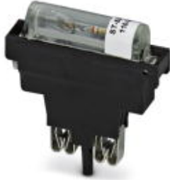
Sicherungsstecker, Nennstrom: 10 A, Länge: 45,4 mm, Breite: 9,9 mm, Farbe: schwarz

Bitte beachten Sie, dass die hier angegebenen Daten dem Online-Katalog entnommen sind. Die vollständigen Informationen und Daten entnehmen Sie bitte der Anwenderdokumentation. Es gelten die Allgemeinen Nutzungsbedingungen für Internet-Downloads. ( http://download.phoenixcontact.de )