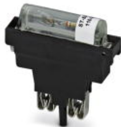
Sicherungsstecker, Nennstrom: 10 A, Länge: 45,4 mm, Breite: 9,9 mm, Farbe: schwarz

Bitte beachten Sie, dass die hier angegebenen Daten dem Online-Katalog entnommen sind. Die vollständigen Informationen und Daten entnehmen Sie bitte der Anwenderdokumentation. Es gelten die Allgemeinen Nutzungsbedingungen für Internet-Downloads. ( http://download.phoenixcontact.de )