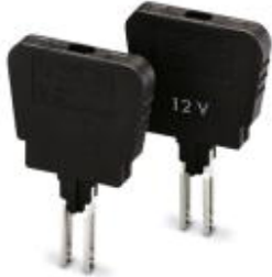
Sicherungsstecker, Nennstrom: 6,3 A, Länge: 33,1 mm, Breite: 6,1 mm, Höhe: 26,5 mm, Farbe: schwarz

Bitte beachten Sie, dass die hier angegebenen Daten dem Online-Katalog entnommen sind. Die vollständigen Informationen und Daten entnehmen Sie bitte der Anwenderdokumentation. Es gelten die Allgemeinen Nutzungsbedingungen für Internet-Downloads. ( http://download.phoenixcontact.de )