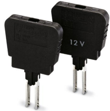
Abbildung zeigt Variante ohne LED/Leuchtanzeige

http://eshop.phoenixcontact.de/phoenix/treeViewClick.do?UID=0921053