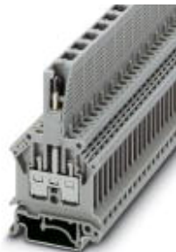
Bauelementenstecker, Polzahl: 1, Farbe: grau

Bitte beachten Sie, dass die hier angegebenen Daten dem Online-Katalog entnommen sind. Die vollständigen Informationen und Daten entnehmen Sie bitte der Anwenderdokumentation. Es gelten die Allgemeinen Nutzungsbedingungen für Internet-Downloads. ( http://download.phoenixcontact.de )