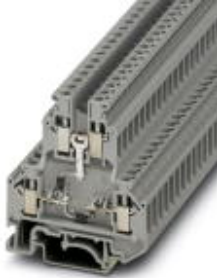
Bauelementreihenklemme, Anschlussart: Schraubanschluss, Querschnitt: 0,2 mm 2 - 4 mm 2 , AWG: 24 - 12, Breite: 6,2 mm, Farbe: grau, Montageart: NS 35/7,5, NS 35/15, NS 32

Bitte beachten Sie, dass die hier angegebenen Daten dem Online-Katalog entnommen sind. Die vollständigen Informationen und Daten entnehmen Sie bitte der Anwenderdokumentation. Es gelten die Allgemeinen Nutzungsbedingungen für Internet-Downloads. ( http://download.phoenixcontact.de )