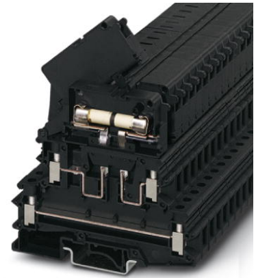
Abbildung zeigt Variante des Artikels

http://eshop.phoenixcontact.de/phoenix/treeViewClick.do?UID=0711629