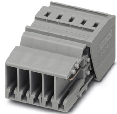
Abbildung zeigt eine 6-polige Variante

http://eshop.phoenixcontact.de/phoenix/treeViewClick.do?UID=3041367