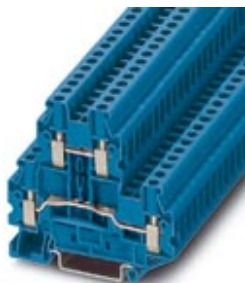
Doppelstock-Klemme, Querschnitt: 0,14 mm 2 - 4 mm 2 , AWG: 26 - 12, Anschlussart: Schraubanschluss, Breite: 5,2 mm, Farbe: blau, Montageart: NS 35/7,5, NS 35/15

Bitte beachten Sie, dass die hier angegebenen Daten dem Online-Katalog entnommen sind. Die vollständigen Informationen und Daten entnehmen Sie bitte der Anwenderdokumentation. Es gelten die Allgemeinen Nutzungsbedingungen für Internet-Downloads. ( http://download.phoenixcontact.de )