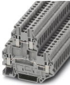
Bauelementreihenklemme, Querschnitt: 0,14 mm 2 - 4 mm 2 , AWG: 26 - 12, Anschlussart: Schraubanschluss, Breite: 5,2 mm, Farbe: grau, Montageart: NS 35/7,5, NS 35/15

Bitte beachten Sie, dass die hier angegebenen Daten dem Online-Katalog entnommen sind. Die vollständigen Informationen und Daten entnehmen Sie bitte der Anwenderdokumentation. Es gelten die Allgemeinen Nutzungsbedingungen für Internet-Downloads. ( http://download.phoenixcontact.de )