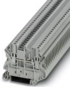
Durchgangsklemme, Anschlussart: Schraubanschluss, Querschnitt: 0,14 mm 2 - 4 mm 2 , AWG: 26 - 12, Breite: 5,2 mm, Farbe: grau, Montageart: NS 35/7,5, NS 35/15

Bitte beachten Sie, dass die hier angegebenen Daten dem Online-Katalog entnommen sind. Die vollständigen Informationen und Daten entnehmen Sie bitte der Anwenderdokumentation. Es gelten die Allgemeinen Nutzungsbedingungen für Internet-Downloads. ( http://download.phoenixcontact.de )