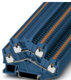
Doppelstock-Klemme, Querschnitt: 0,14 mm 2 - 4 mm 2 , AWG: 26 - 12, Anschlussart: Push-in-Anschluss, Breite: 5,2 mm, Farbe: blau, Montageart: NS 35/7,5, NS 35/15

Bitte beachten Sie, dass die hier angegebenen Daten dem Online-Katalog entnommen sind. Die vollständigen Informationen und Daten entnehmen Sie bitte der Anwenderdokumentation. Es gelten die Allgemeinen Nutzungsbedingungen für Internet-Downloads. ( http://download.phoenixcontact.de )