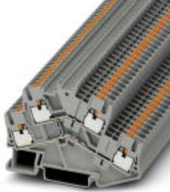
Doppelstock-Klemme, Querschnitt: 0,14 mm 2 - 4 mm 2 , AWG: 26 - 12, Anschlussart: Push-in-Anschluss, Breite: 5,2 mm, Farbe: grau, Montageart: NS 35/7,5, NS 35/15

Bitte beachten Sie, dass die hier angegebenen Daten dem Online-Katalog entnommen sind. Die vollständigen Informationen und Daten entnehmen Sie bitte der Anwenderdokumentation. Es gelten die Allgemeinen Nutzungsbedingungen für Internet-Downloads. ( http://download.phoenixcontact.de )