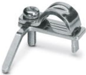
Schirmanschlussschelle für Leiterplattenklemme

Bitte beachten Sie, dass die hier angegebenen Daten dem Online-Katalog entnommen sind. Die vollständigen Informationen und Daten entnehmen Sie bitte der Anwenderdokumentation. Es gelten die Allgemeinen Nutzungsbedingungen für Internet-Downloads. ( http://download.phoenixcontact.de )