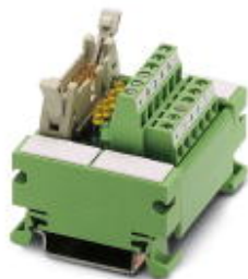
VARIOFACE-COMPACT-LINE, Übergabemodul für 8 Kanäle, mit Leuchtanzeige, zur Montage auf Tragschiene NS 35/7,5, Schraubanschluss

Bitte beachten Sie, dass die hier angegebenen Daten dem Online-Katalog entnommen sind. Die vollständigen Informationen und Daten entnehmen Sie bitte der Anwenderdokumentation. Es gelten die Allgemeinen Nutzungsbedingungen für Internet-Downloads. ( http://download.phoenixcontact.de )