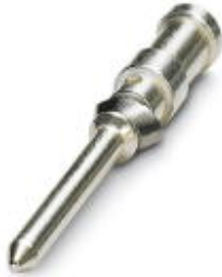
Gedrehter 1,6er Crimpkontakt, Stift-Einzelkontakt, Aderquerschnitt 0,5 mm 2 , versilbert

Bitte beachten Sie, dass die hier angegebenen Daten dem Online-Katalog entnommen sind. Die vollständigen Informationen und Daten entnehmen Sie bitte der Anwenderdokumentation. Es gelten die Allgemeinen Nutzungsbedingungen für Internet-Downloads. ( http://download.phoenixcontact.de )