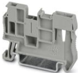
Rastflansch, Breite: 5,2 mm, Höhe: 35,3 mm, Farbe: grau, Montageart: NS 35/7,5, NS 35/15

Bitte beachten Sie, dass die hier angegebenen Daten dem Online-Katalog entnommen sind. Die vollständigen Informationen und Daten entnehmen Sie bitte der Anwenderdokumentation. Es gelten die Allgemeinen Nutzungsbedingungen für Internet-Downloads. ( http://download.phoenixcontact.de )