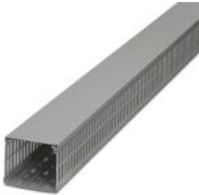
Verdrahtungskanal, grau, bestehend aus Ober- und Unterteil, Breite: 60 mm, Höhe: 100 mm, Länge 2000 mm

Bitte beachten Sie, dass die hier angegebenen Daten dem Online-Katalog entnommen sind. Die vollständigen Informationen und Daten entnehmen Sie bitte der Anwenderdokumentation. Es gelten die Allgemeinen Nutzungsbedingungen für Internet-Downloads. ( http://download.phoenixcontact.de )