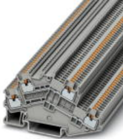
Doppelstock-Klemme, Querschnitt: 0,14 mm 2 - 1,5 mm 2 , AWG: 26 - 14, Anschlussart: Push-in-Anschluss, Breite: 3,5 mm, Farbe: grau, Montageart: NS 35/7,5, NS 35/15

Bitte beachten Sie, dass die hier angegebenen Daten dem Online-Katalog entnommen sind. Die vollständigen Informationen und Daten entnehmen Sie bitte der Anwenderdokumentation. Es gelten die Allgemeinen Nutzungsbedingungen für Internet-Downloads. ( http://download.phoenixcontact.de )