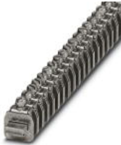
Anschlussklemme, Anschlussart Schraubanschluss, Belastungsstrom: 41 A, Querschnitt: 0,5 mm 2 - 6 mm 2 , Breite: 7 mm, Farbe: silberfarben

Bitte beachten Sie, dass die hier angegebenen Daten dem Online-Katalog entnommen sind. Die vollständigen Informationen und Daten entnehmen Sie bitte der Anwenderdokumentation. Es gelten die Allgemeinen Nutzungsbedingungen für Internet-Downloads. ( http://download.phoenixcontact.de )